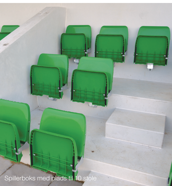
Spillerboks med plads til 10 stole

Tribuneelementerne er klargjort med montagehuller i bagvæggen samt skinner på fronten af taget, så I kan montere reklamebannere og give jeres sponsorer en unik opmærksomhed.