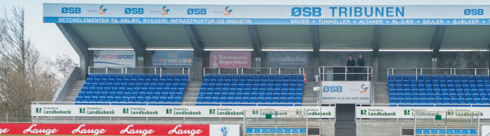
Ringkøbing, foto: Henrik Olesen