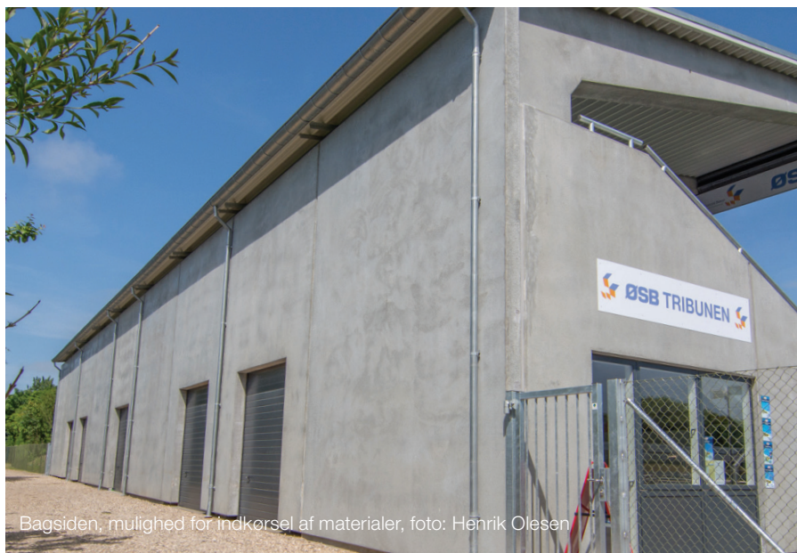
Bagsiden, mulighed for indkørsel af materialer, foto: Henrik Olesen