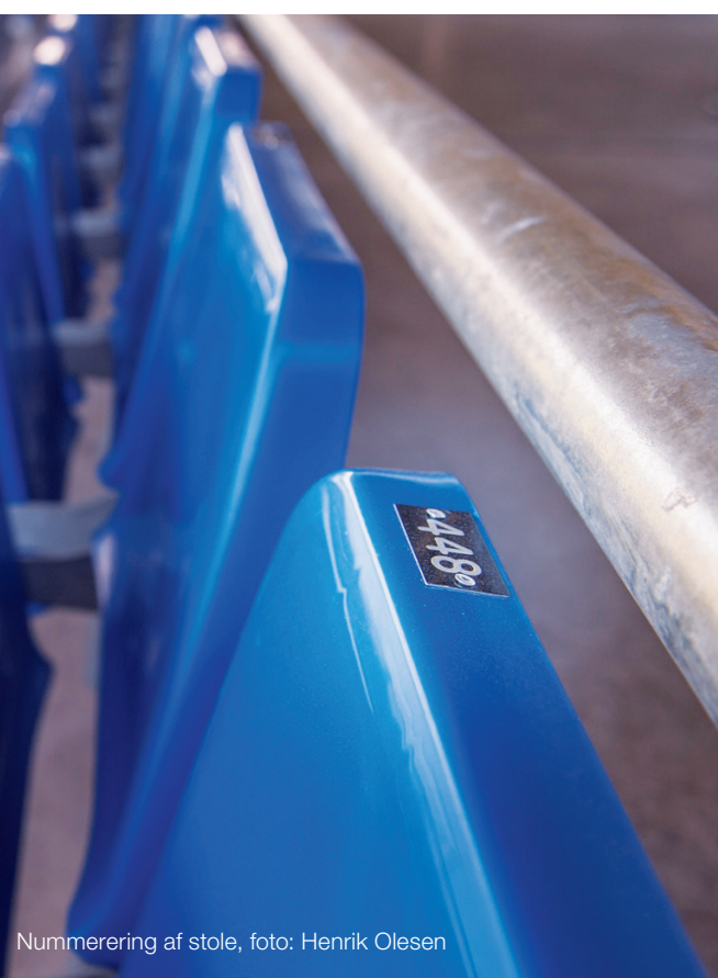
Nummerering af stole, foto: Henrik Olesen