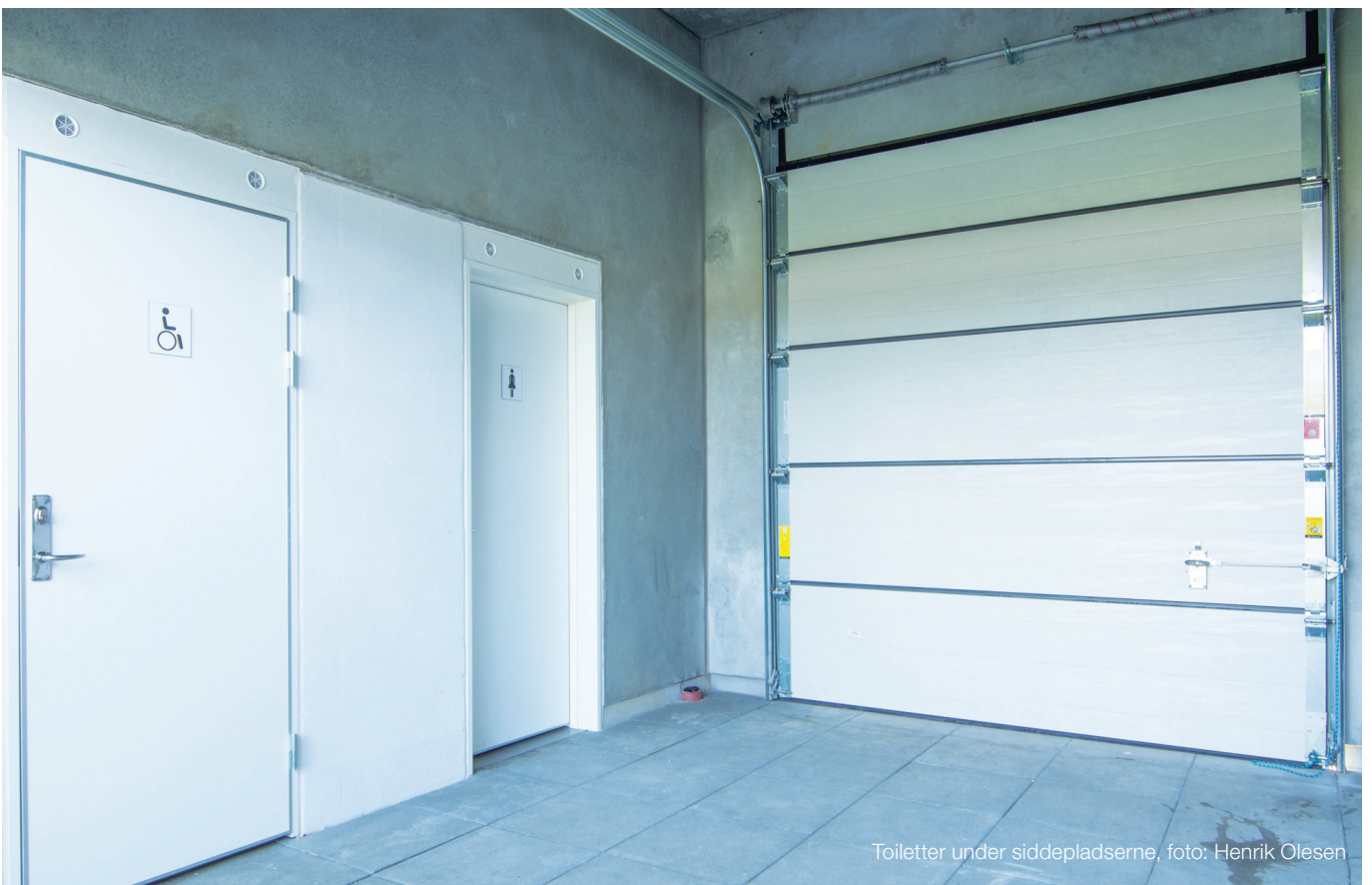
Toiletter under siddepladserne

Vi sørger selvfølgelig for, at tribunen bliver monteret, med alt hvad det indebærer - inklusiv den sidste afsluttende finish med bløde fuger. Montagen udføres af vores erfarne montører.