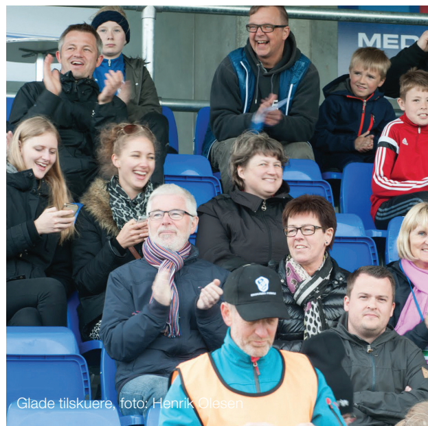
Glade tilskuere