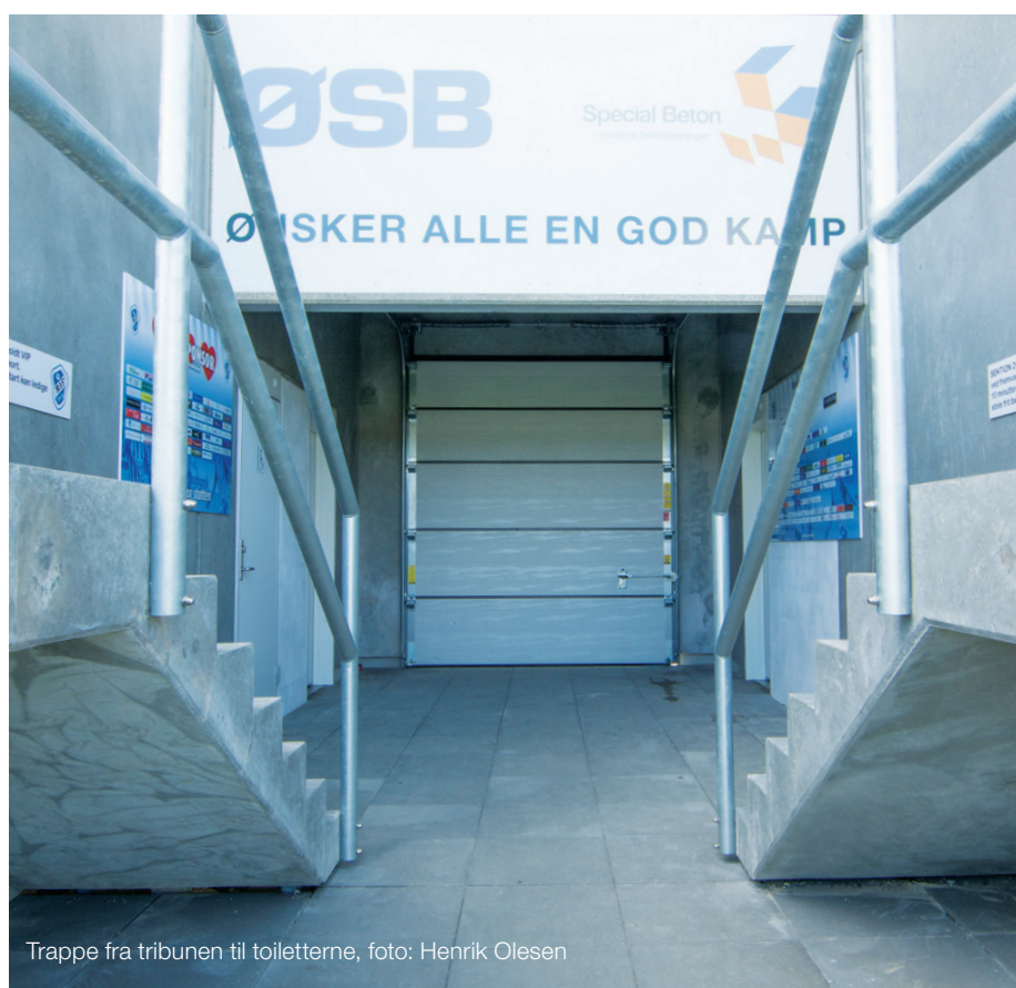
Trappe fra tribunen til toiletterne