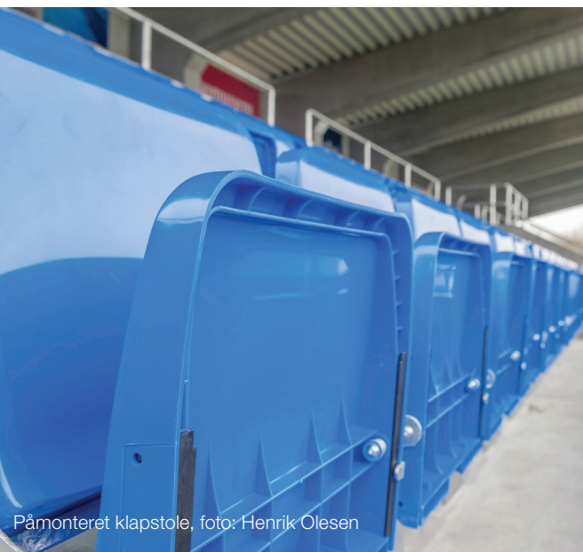
Påmonteret klapstole